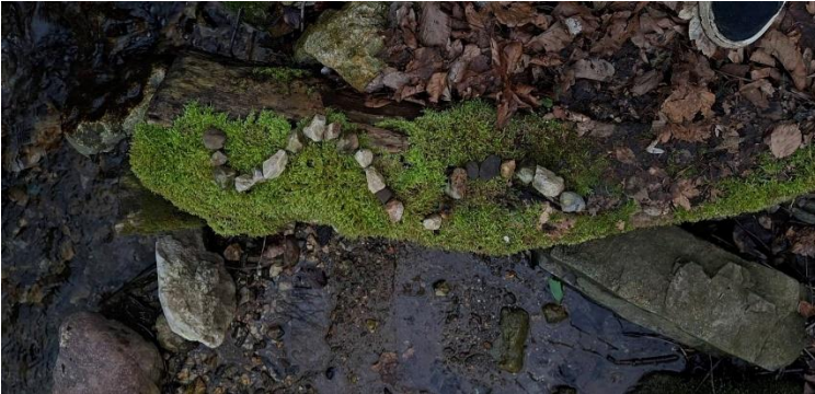
Slika 5: Land art ob vodi iz kamenčkov.

V prostor je mogoče nemoteče postaviti elemente land arta, ki spoštujejo naravo, uporabljajo naravne materiale ter obiskovalca povabijo ne le k opazovanju, dotiku in razmisleku, ampak tudi k ustvarjanju lastne land art »umetnine«.