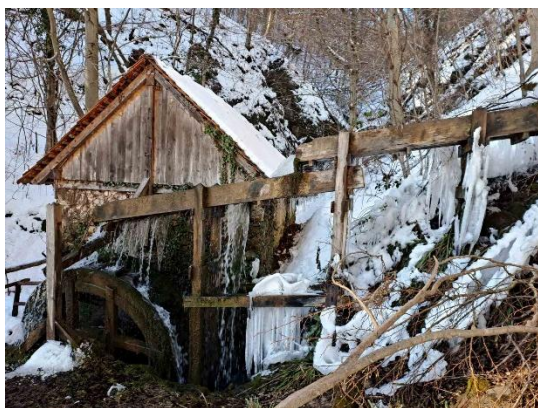
Slika 8: Strnišev mlin v zimskih razmerah.

V mesecu februarju 2026 je zaradi zimskih razmer okolica neurejena (odpadle veje, podrti drevo), zato jo je pred izvedbo programa treba očistiti in urediti. 14 Prostor je trenutno priljubljeno zbirališče mladih, ki tam preživljajo prosti čas, zato bo nujno sodelovanje z lokalno skupnostjo tudi pri urejanju rabe prostora in ozaveščanju o novi namembnosti. Zaradi vremenskih razmer (sneg, dež, led, mraz) prostor ni primeren za celoletno uporabo. Programi bodo morali biti sezonski, kar omejuje število terminov in potencialni obisk. Treba je tudi zagotoviti usklajenost z varstvenimi smernicami, saj gre za naravno in kulturno občutljiv prostor. Vse navedeno vpliva tudi na obseg posegov in oblikovanje nekaterih aktivnosti. Menimo, da so prav omejitve tudi svojevrstna prednost našega projekta, saj spodbujajo butičnost, trajnost in avtentičnost, ki so temeljne vrednote tega projekta.