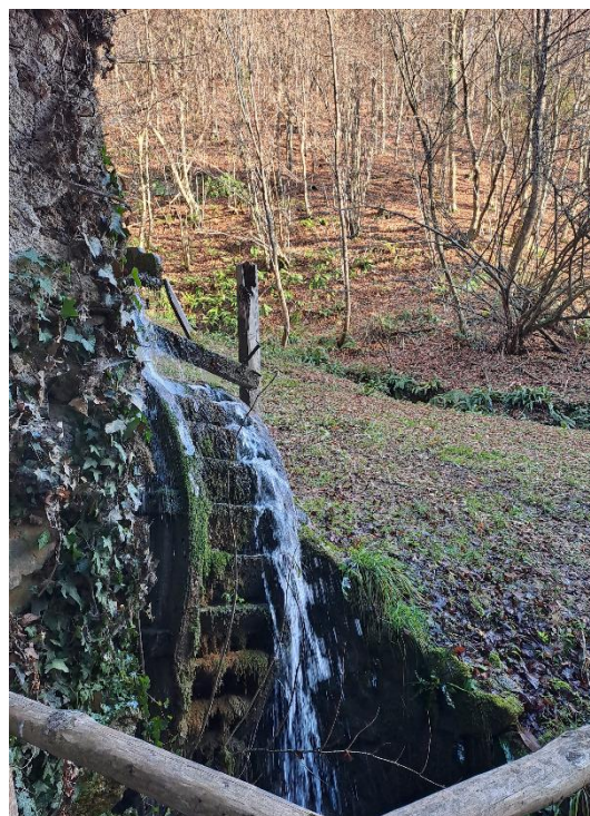
Slika 9: Obnovljeno mlinsko kolo, ki se je zaradi teže in prešibkih vodil delno snelo s svoje osi, je potrebno popravila.