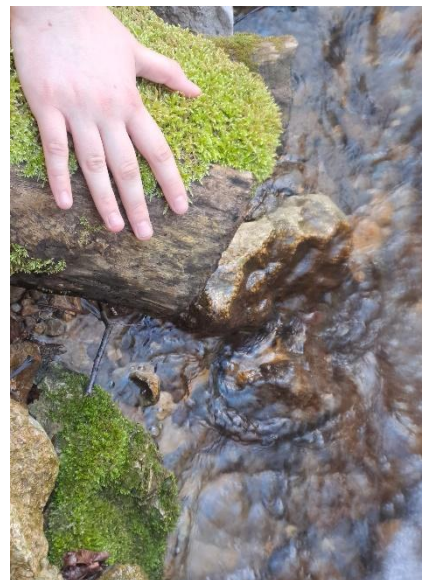
Slika 6: Senzorična izkušnja ob dotikanju naravnih materialov.

Šumenje potoka in ritmično vrtenje mlinskega kolesa sta poleg glasov iz narave (ptice, šumenje dreves) glavna nosilca zvoka. Svetloba je mehka in naravna. Udeleženci se dotikajo naravnih materialov: lesa, mahu, kamna, vode, sedijo na preprostih počivalnikih, narejenih iz trajnostnih materialov. Vonj po gozdu, lesu in užitnih rastlinah.