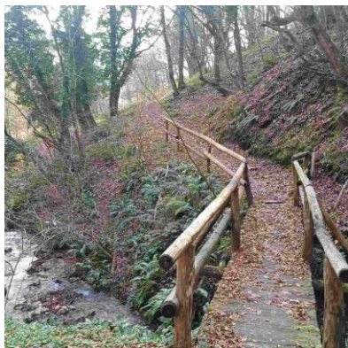
Slika 7: Postavljene brvi do lokacije zagotavljajo osnovno infrastrukturo.

obnovljen že leta 2014, zato je mogoča vzpostavitev prostora za turistične potrebe brez večjih gradbenih posegov, potrebna je le pritrditev delno snetega mlinskega kolesa, ki zahteva dodatna sredstva in strokovno obnovo 13 in obnovitev notranje opreme mlina. Brvi so že postavljene, kar pomeni, da je osnovna infrastruktura prisotna in za obiskovalce varna.