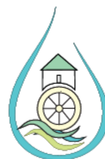
Slika 4: Logotip našega turističnega produkta Vodo v dlan za lepši dan s stilizirano podobo vodnega mlina v objemu "odprte" vodne kapljice.

Vizija našega produkta je ustvariti prostor in dejavnosti, skozi katere se obiskovalci lahko umaknejo od digitalnega sveta, upočasnijo in ponovno vzpostavijo stik s sabo.