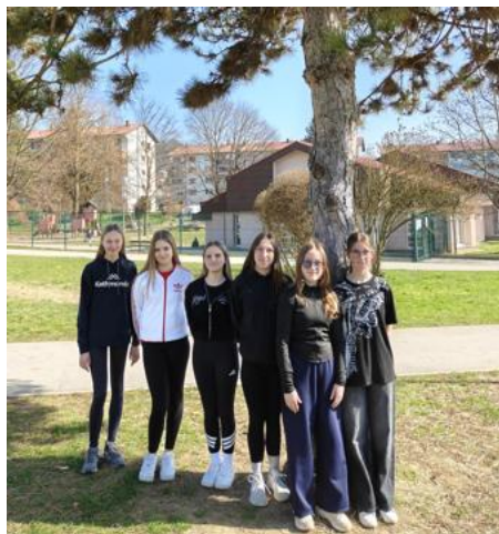
Slika 1: Avtorice raziskovalne naloge