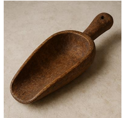
Slika 10: Leseni žlebiček za pitje vode. 16

Ko niso imeli žlebička so uporabili lapuhov list, ki so ga oblikovali v lonček.