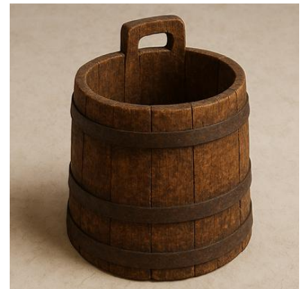
Slika 11: Čeber, v kakršnem so v časih brez vodovoda shranjevali vodo.

Čeber je večja lesena posoda z lesenim »ušesom«, ki je služila za shranjevanje večjih količin vode, zlasti v sušnih obdobjih, ko so bili izviri šibkejši ali bolj oddaljeni.