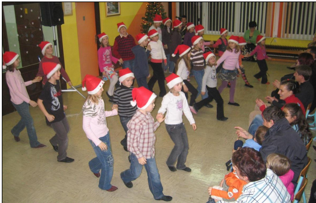
Drobtinica sreče za Društvo Sožitje