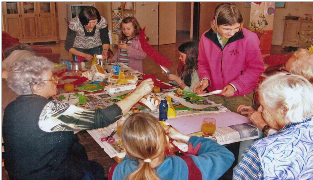
Likovna delavnica v Pegazovem domu Rogaška Slatina