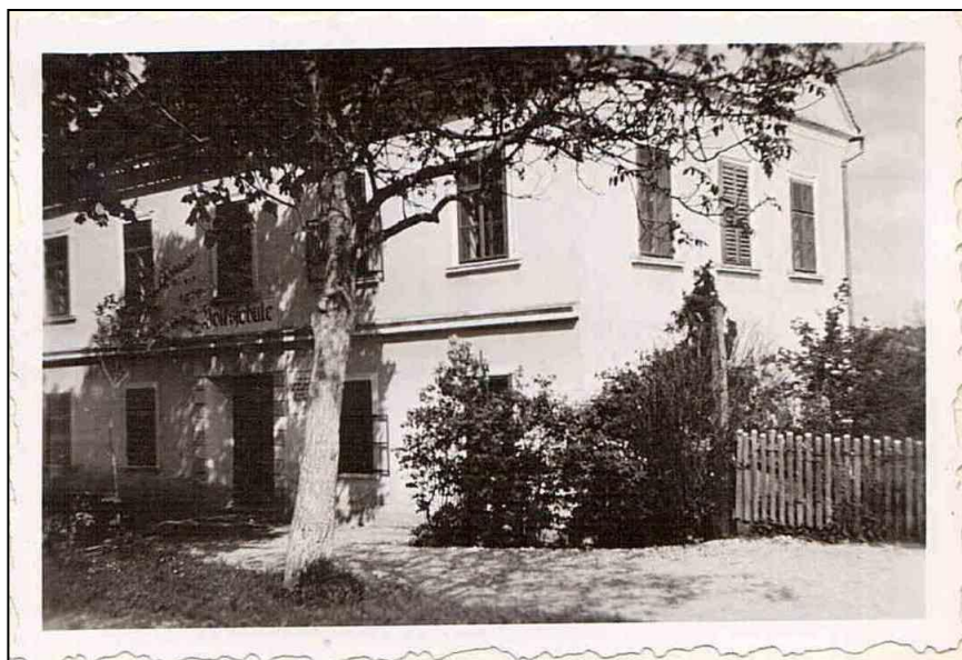
Kostrivniška šola med 2. svetovno vojno